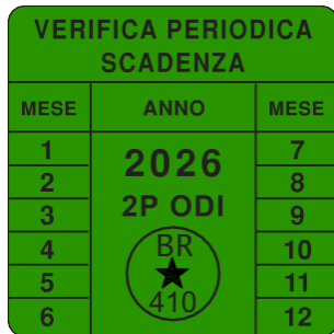
Etichetta Scadenza Verifica Periodica