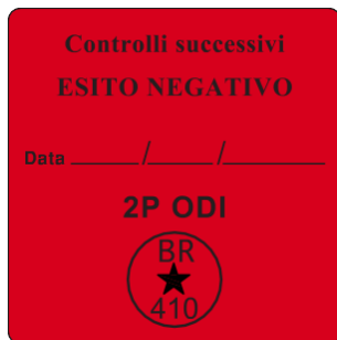
Etichetta Esito negativo